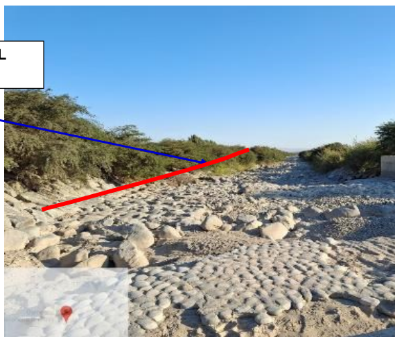
FIGURA N°01: TRAMO CRÍTICO EN EL RÍO ICA SECTOR BOCATOMA QUILLOAY II, DISTRITO SAN JUAN BAUTISTA, PROVINCIA DE ICA - DEPARTAMENTO DE ICA.