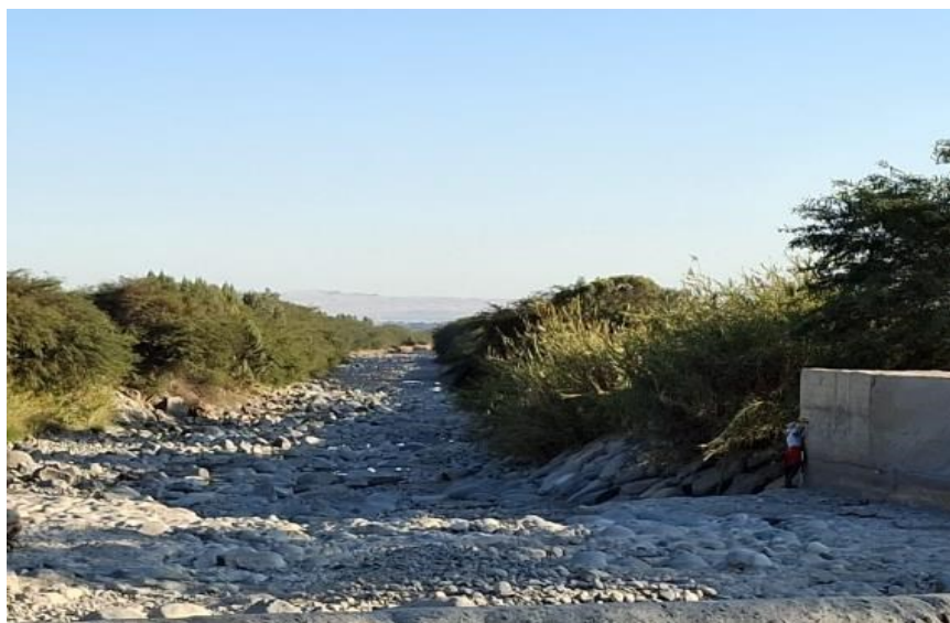
FIGURA N°02: EN LA TEMPORADA DE MAXIMAS AVENIDAS, EL RÍO ICA SE DESBORDA EN ESTE TRAMO DEL SECTOR BOCATOMA QUILLOAY II, DISTRITO SAN JUAN BAUTISTA, ARRASANDO CON TODO LO QUE